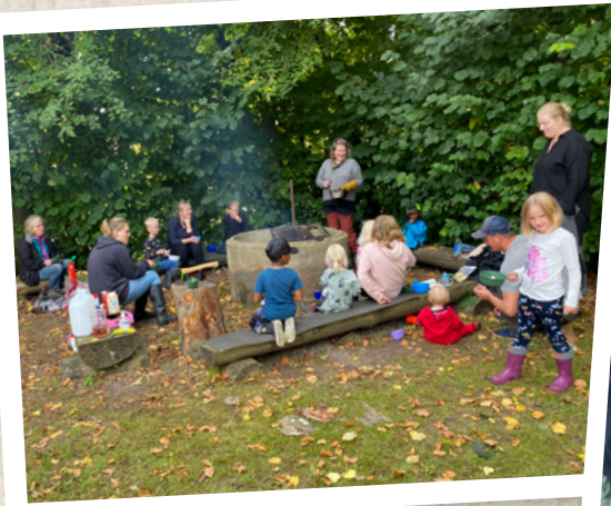
Samling kring eldstaden.