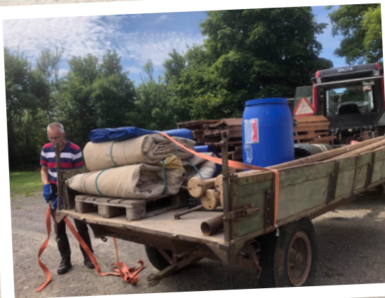
Tältet är nedtaget och skall åter packas in i Rickarum.