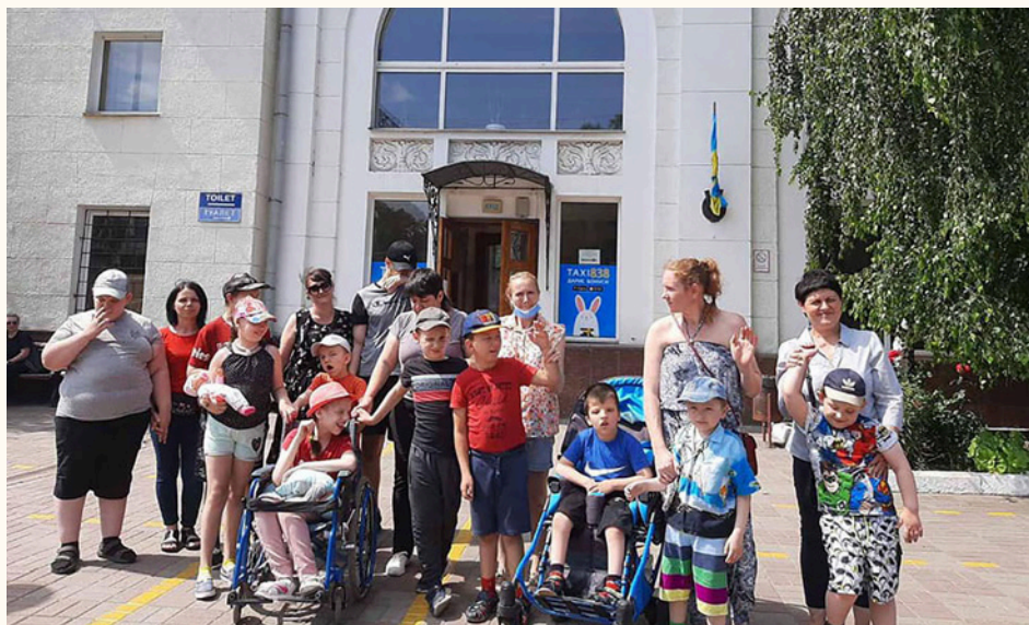
Personal och barn framför hjälpcentret i staden Kropyvnytskyi i Ukraina.