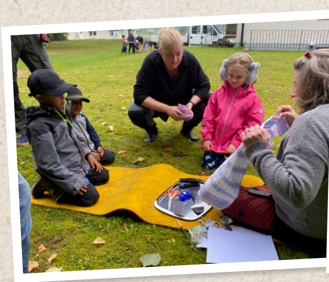
Familjescout i Nävlinge.