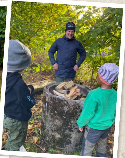
Eldning på familjescout.