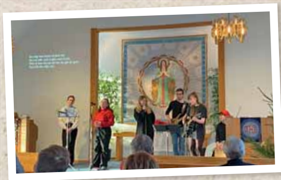
Lovsång i Nävlinge.