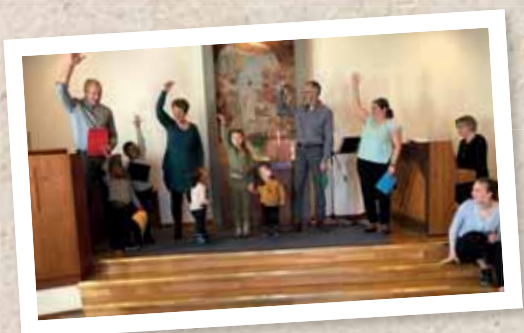
Rörelsesång på gudstjänst.