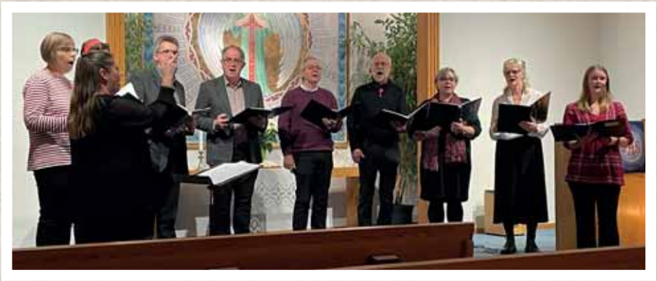
Adventsgudstjänst i Rickarum.