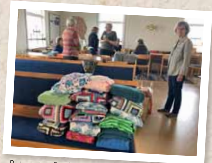
Babypaket. Färdigpackade hjälpsändningar.