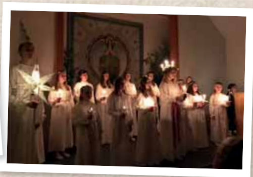
Luciafest i Rickarum.