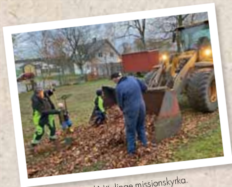
Höststädning vid Nävlinge missionskyrka.