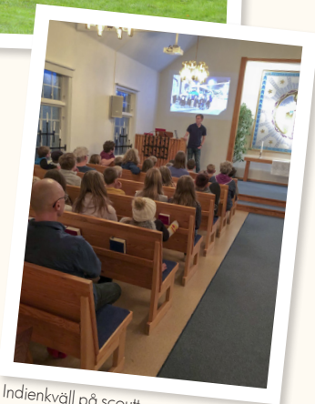
Indienkväll på scout