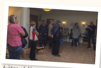
Auktion på Almas secondhand