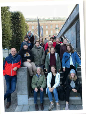
Ledarna som var med på Växa som ledare i Stockholm