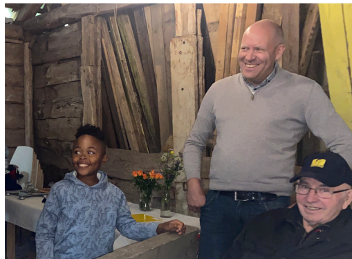
Mästarnas mästare på gemenskapsdag.