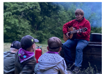
Lägerbål på scouthajk.