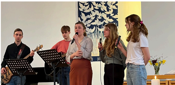
Påskdagsgudstjänst i Odalskyrkan.