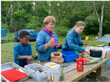
Hamburgare som kvällsmat på scouthajk.