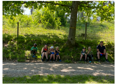
Välbehövlig lunchpaus i skuggan.