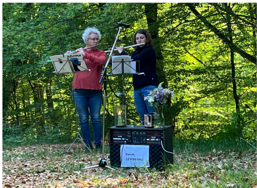
Flöjtspel på Slätthulshäll.