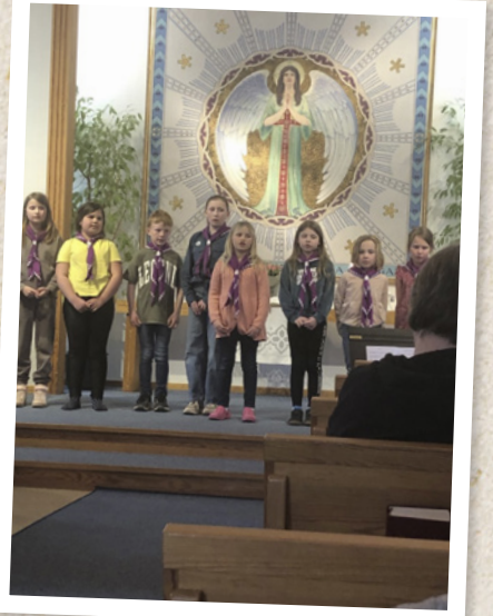
Scoutinvigning i Rickarum den 2 april.