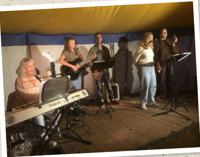
Allsångskväll i Nävlinge den 23 juli.