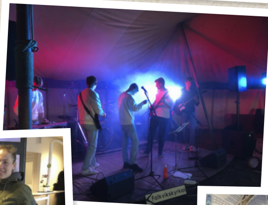
Rockkonseri i Nävlinge den 16 juli.