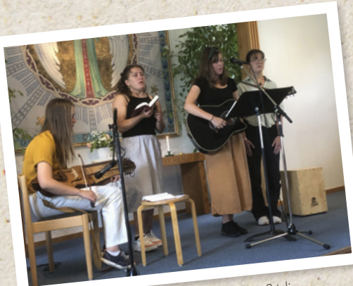
Invigningsgudstjänst för "Sommar i byn" den 3 juli.