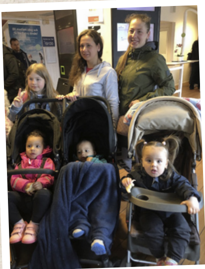
Våra Ukrainska vänner reser hem till Kiev.