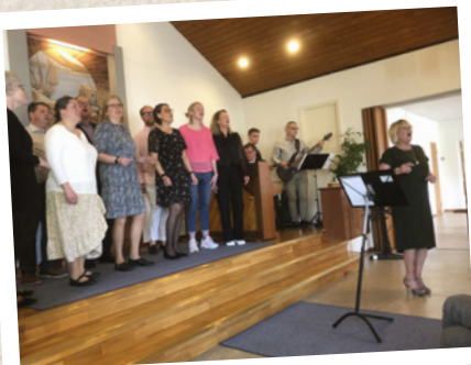
Joycing från Vinslöv sjunger i Nävlinge missionskyrka den 8 maj.