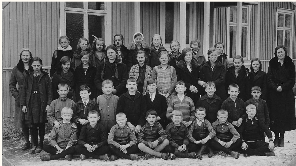
Rickarums missionshus användes under en period av Rickarums privata folkskola. Här är klass 3-6 åren 1930-31.