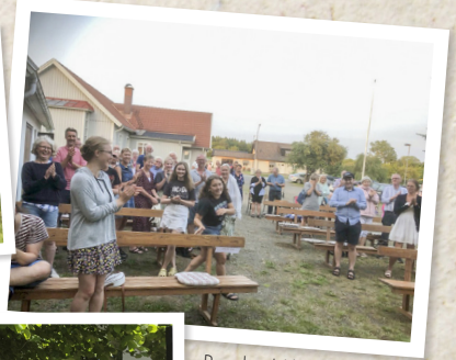
Road publik på rockkonserten.