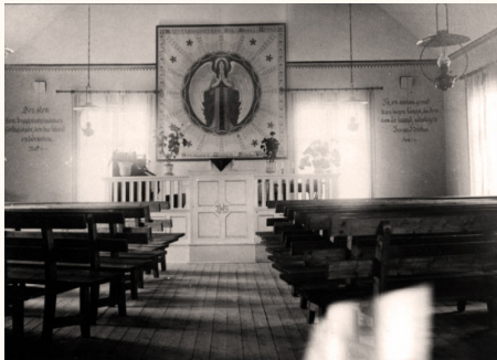
Interiör från Rickarums missionshus 1922.