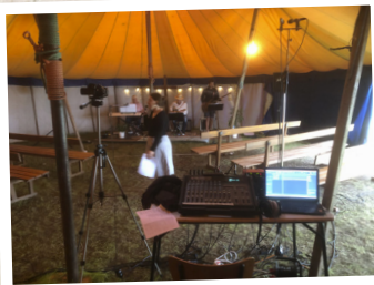
Förberedelse inför allsångkväll i Nävlinge.