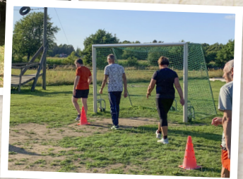
Cirkelträning på skolgården.