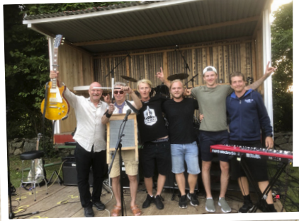
The Rock från Sölvesborg.