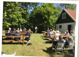
Gudstjänst vid missionskyrkan i Rickarum.