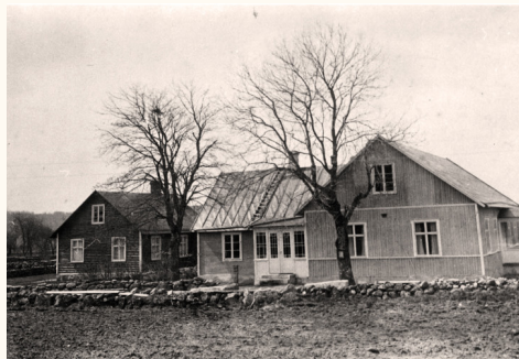
Rickarums missionshus 1922.