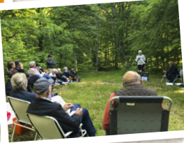
Gudstjänst på Slatthults hall.