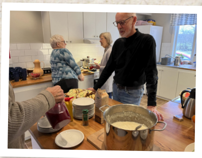
I köket vid lullunch den 20 december.