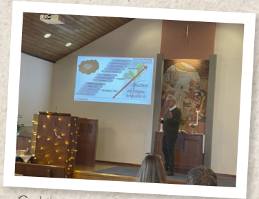
Gudstjänst i Nävlinge den 10 mars.