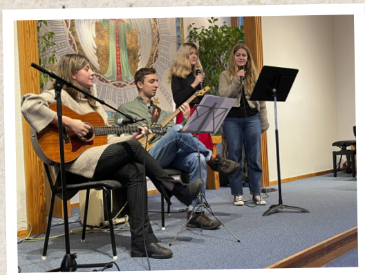
Gudstjänst i Rickarum den 26 december.