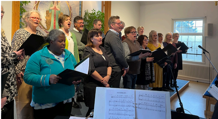
Gudstjänst tillsammans med Tureholmskyrkan den 3 mars.