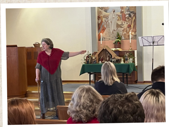
Julbön i Nävlinge den 24 december.