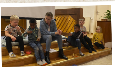
Samtal med barnen i Nävlinge.