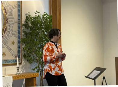
Gudstjänst tillsammans med Tureholmskyrkan den 3 mars.