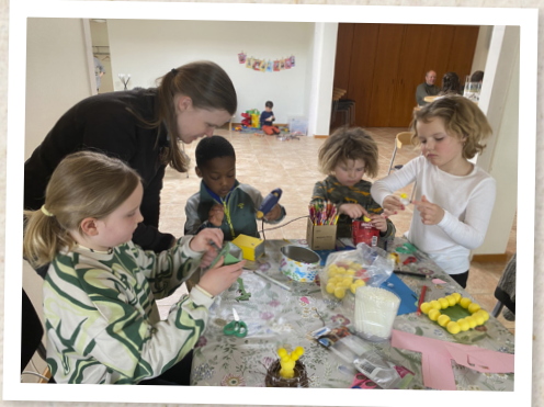
Pysell i Nävlinge.