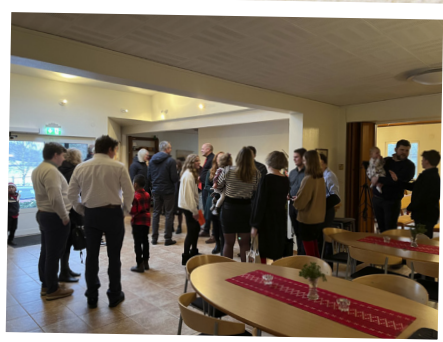
Mingel efter julbönen den 24 december.