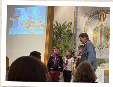
Scoutinvigning i Rickarum den 16 mars.