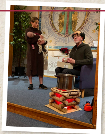
Dramatisering på adventsgudstjänst.