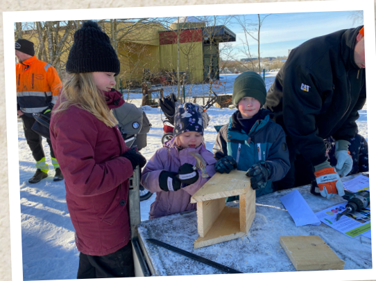
Fågelholkstillverkning på scoutlördag.