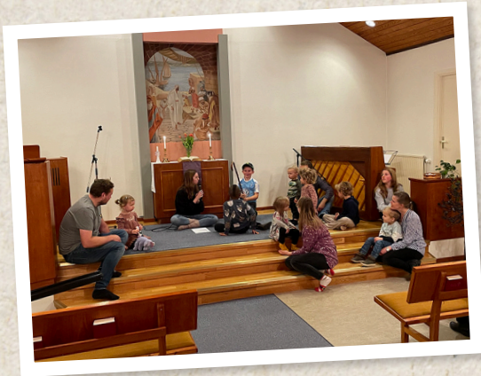
Andakt på Taccokväll i Nävlinge.