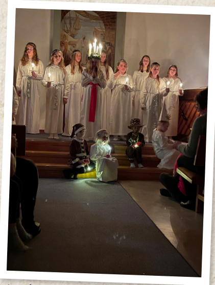
Luciafest i Nävlinge.