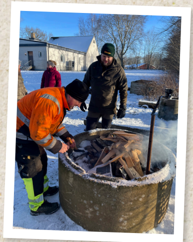
Eldning på scoutlördag.