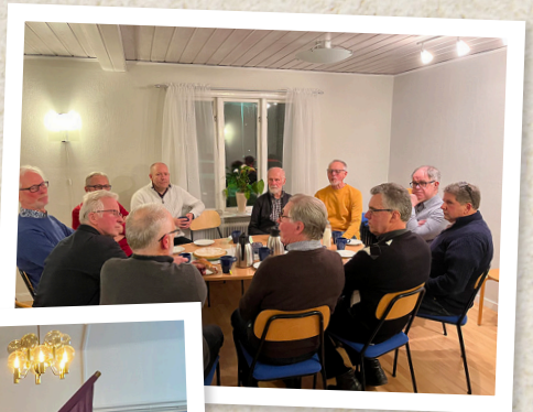
Fika på manskörsövning.