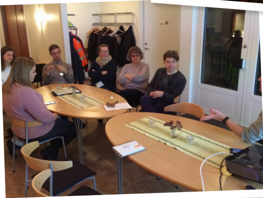
UR Nävlinge - Rickarum.