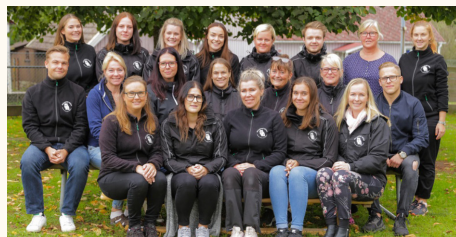
Personal på Rickarums skola.

Skolföreningen som bildades hösten 2011 har varit modiga, beslutsamma och fram-