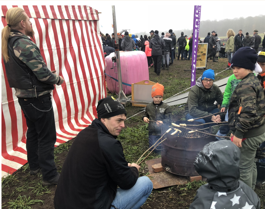
Pinnbrödsbak på traktorrace i Nävlinge.