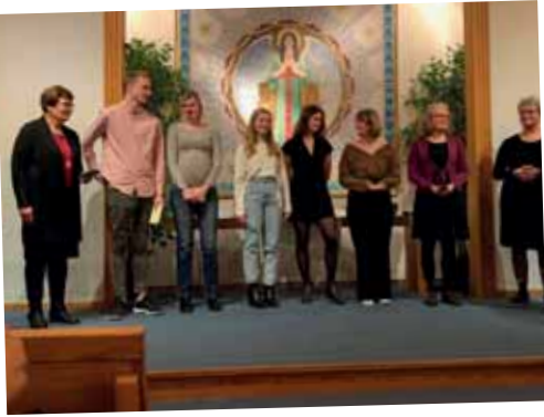
Tack till ledare i eumenia.