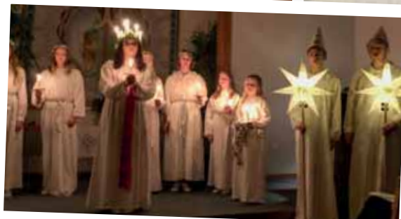
Luciafest i Rickarums missionskyrka.