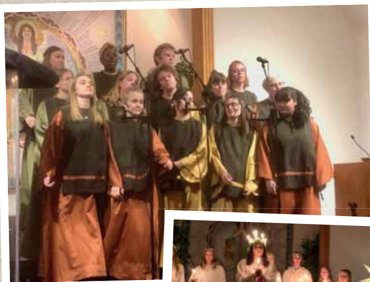
Ashira Gospel Choir i Rickarums missionskyrka.