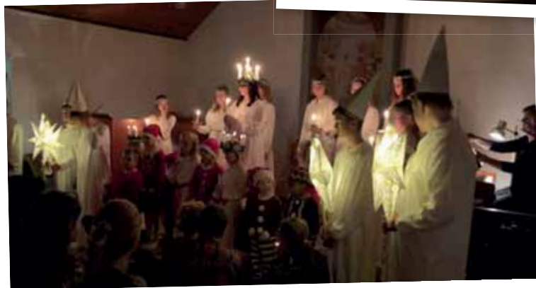
Luciafest i Nävlinge missionskyrka.