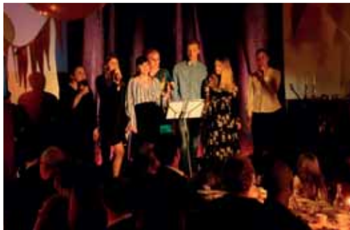
Häutigalan den 10/2.