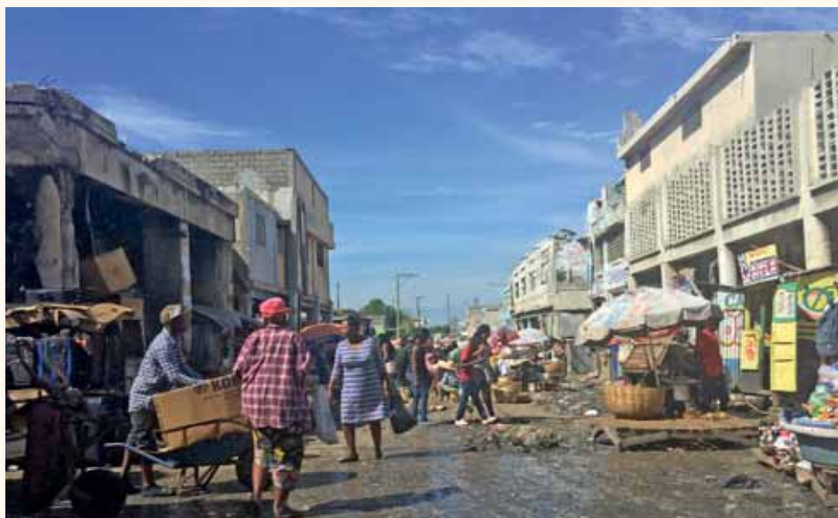
Port au Prince blev en upplevelse.