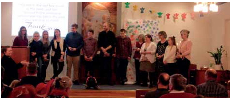
Tack till ledarna för 2017.