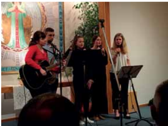
Gudstjänst den 28/1.