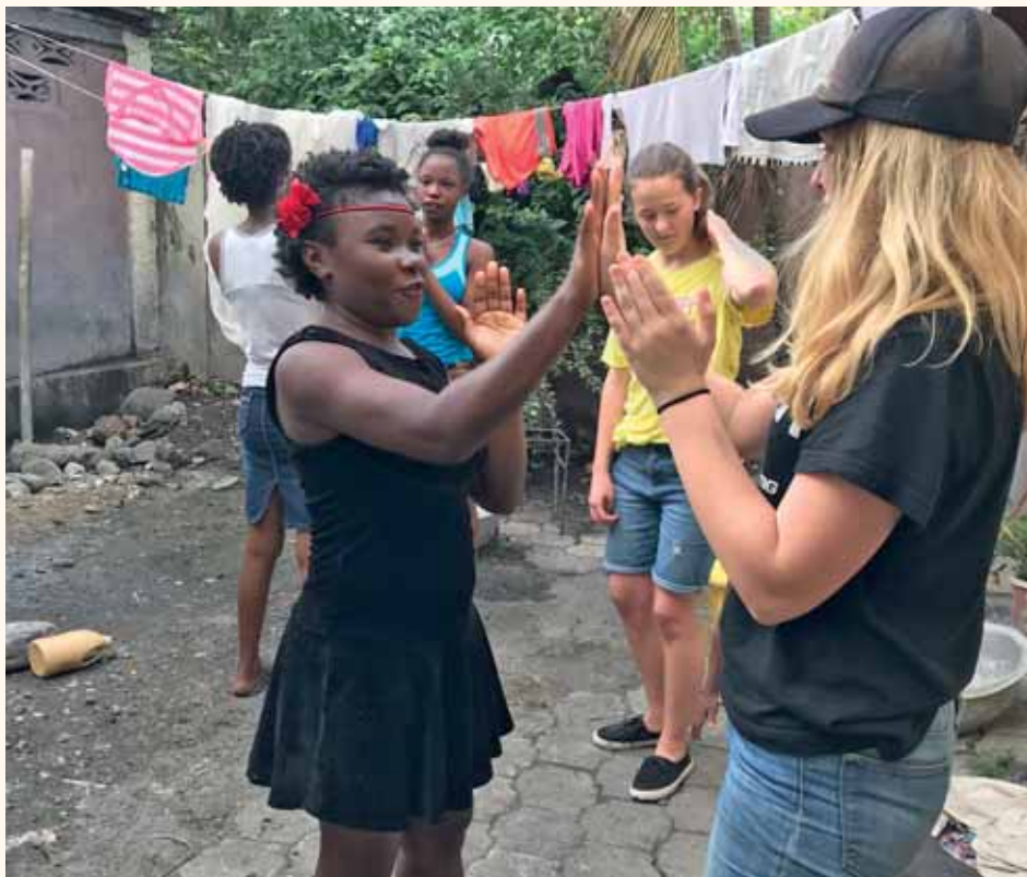
Vänner tillsammans på Haiti.