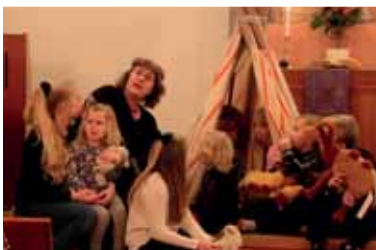
Drama av Barntimmarna på Luciafesten i Nävlinge 10/12.