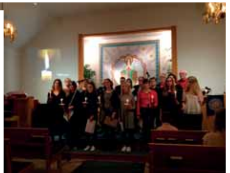
Musik i advent den 2/12.