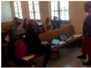
Förberedelsemöte inför resan till Haiti.