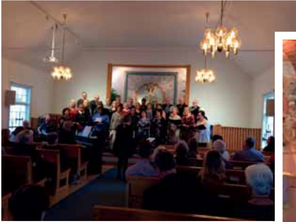
Gudstjänst den 19/11 med Tillsammanskören och Första Avenyn.