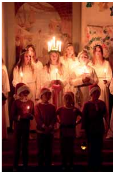
Luciafest i Nävlinge den 10/12.