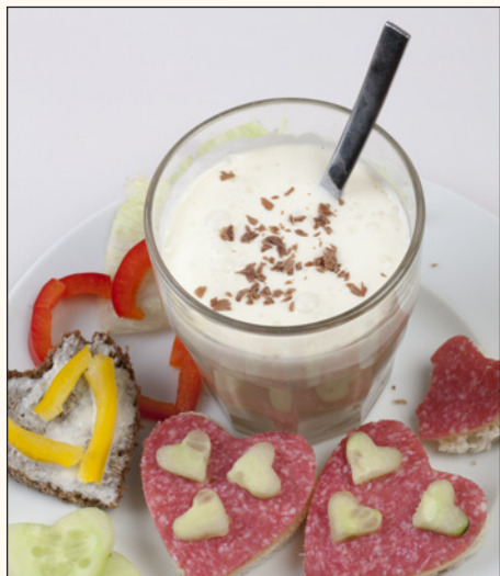
En god frukost är en riktigt bra vana.

och andra jobbiga tillfällen i livet. ”Det är aldrig fel att visa omtanke om andra.”