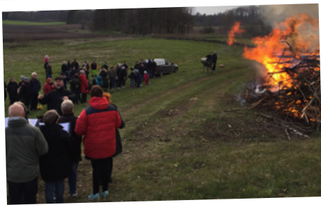
Vårbrasa i Nävlinge