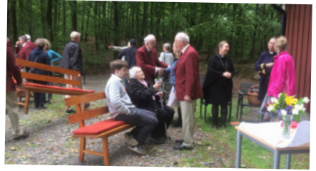
Equmenisk gudstjänst i kyrkans skog i Brostorp.