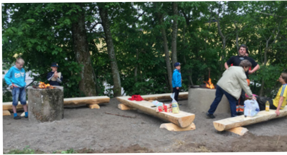
Invigning av grillplats i Nävlinge.