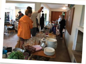
Sommarloppis på Almas Secondhand i Nävlinge.