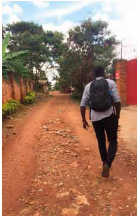
"Att byta ett ord eller två gjorde det lättare att gå." En strof ur dikten "Människors möten" av Hjalmar Gullberg.

Utresedatum bestämdes, men när det var dags hade Migrationsverket inte alla papper från ambassaden klara och datumet flyttades fram, något som hände vid flertal tillfälle. När Migrationsverket så småning-