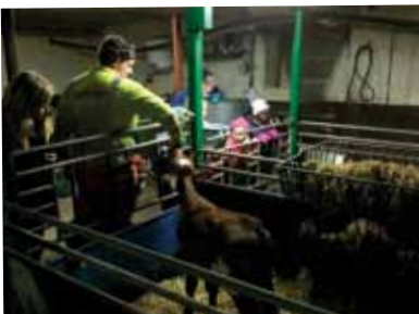
Scoutväll i Nävlinge.