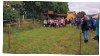
Rickarums buastafett, Start barnloppet.