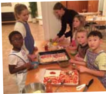
Pizzakväll på scout i Nävlinge.