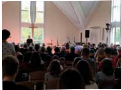
Regionsfest på Bosarpsgården den 7/10.