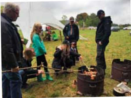
Scouterna medverkade på Södras skogsdag i Håkan köp.